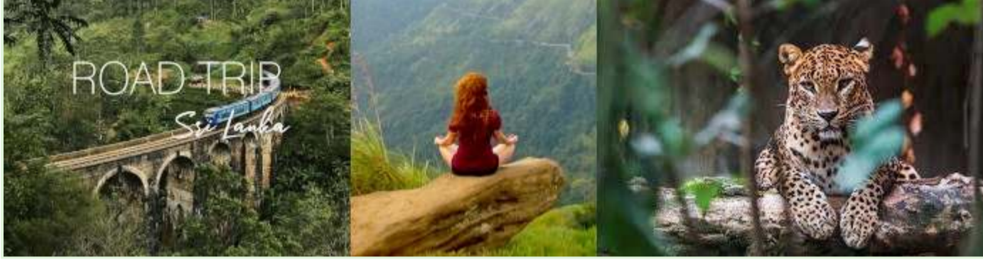
Sri Lanka tatilleri - Rehberli doğa turları ve keşif gezileri

Zamanlama: Deney, Sri Lanka'nın turizme bağımlı ekonomisinin zaten ciddi şekilde etkilendiği COVID-19 salgını sırasında başlatıldı.